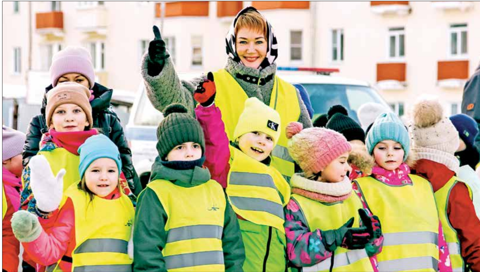
ПОДАРКИ детям от АЦБК для безопасности дорожного движения