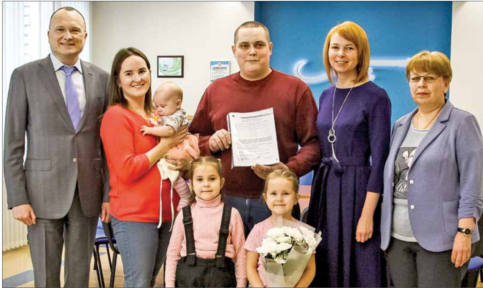
СЕМЬЯ КУЗНЕЦОВЫХ благодаря Архангельскому ЦБК получила сертификат на улучшение жилищных условий