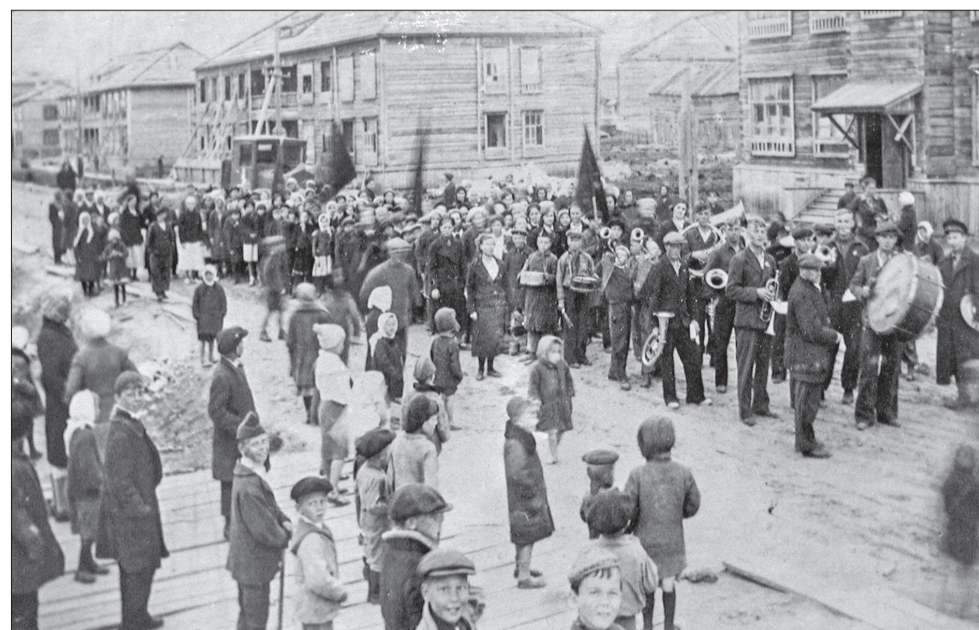
Первомайская демонстрация в рабочем посёлке при строительстве Архбумкомбината, 1930-е годы

С 2004 года в Трудовой кодекс РФ были внесены поправки, согласно которым Праздником Весны и Труда остался лишь один день – 1 мая.