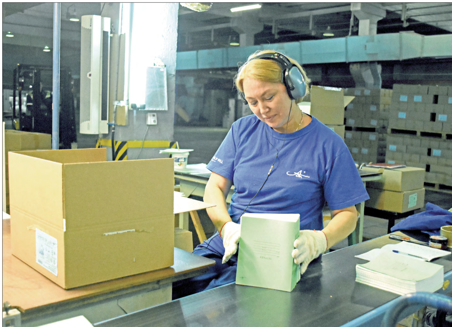
В ЦЕХЕ бумажных изделий производства бумаги комбината