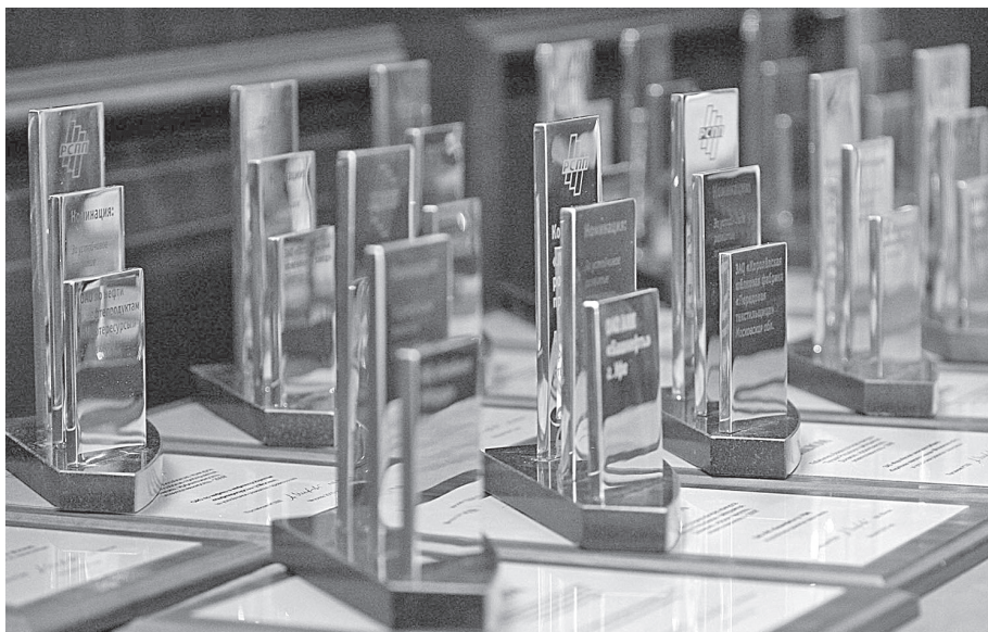
Награды, вручаемые победителям Всероссийского конкурса «Лидеры российского бизнеса: динамика и ответственность»