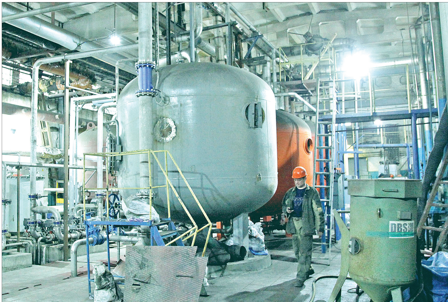
ЦЕНТРАЛЬНАЯ станция сбора и очистки конденсата химцеха ТЭС-1