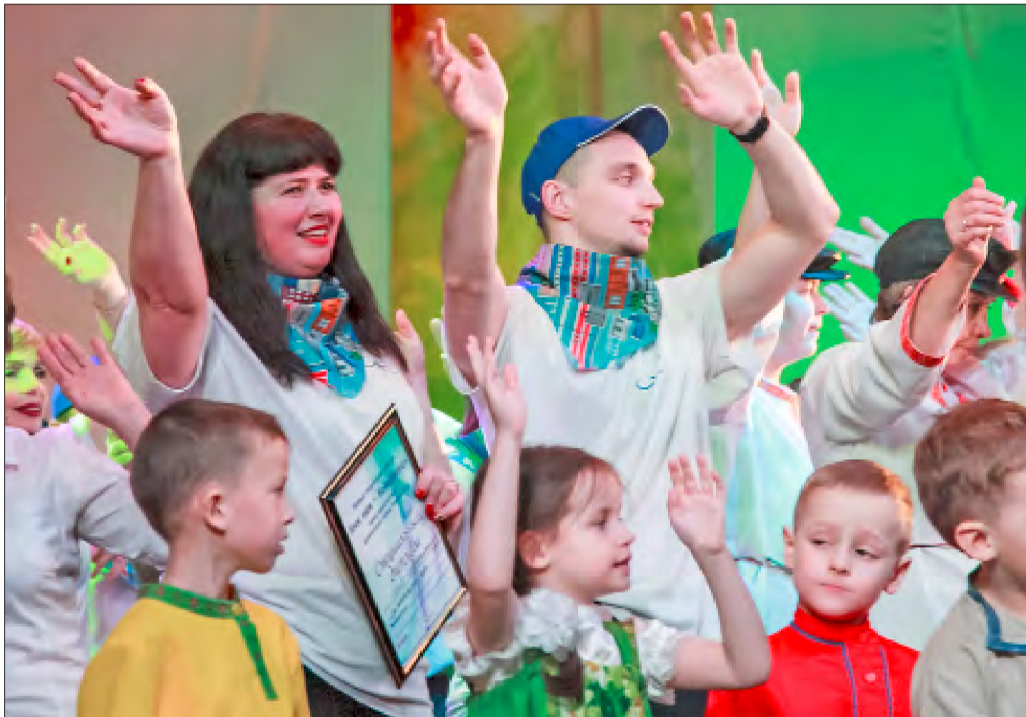
ТВОРЧЕСКАЯ сборная ремонтно-механического производства АЦБК на конкурсе «Имя нам – новодвинцы!» отмечена специальным дипломом «За командный дух»