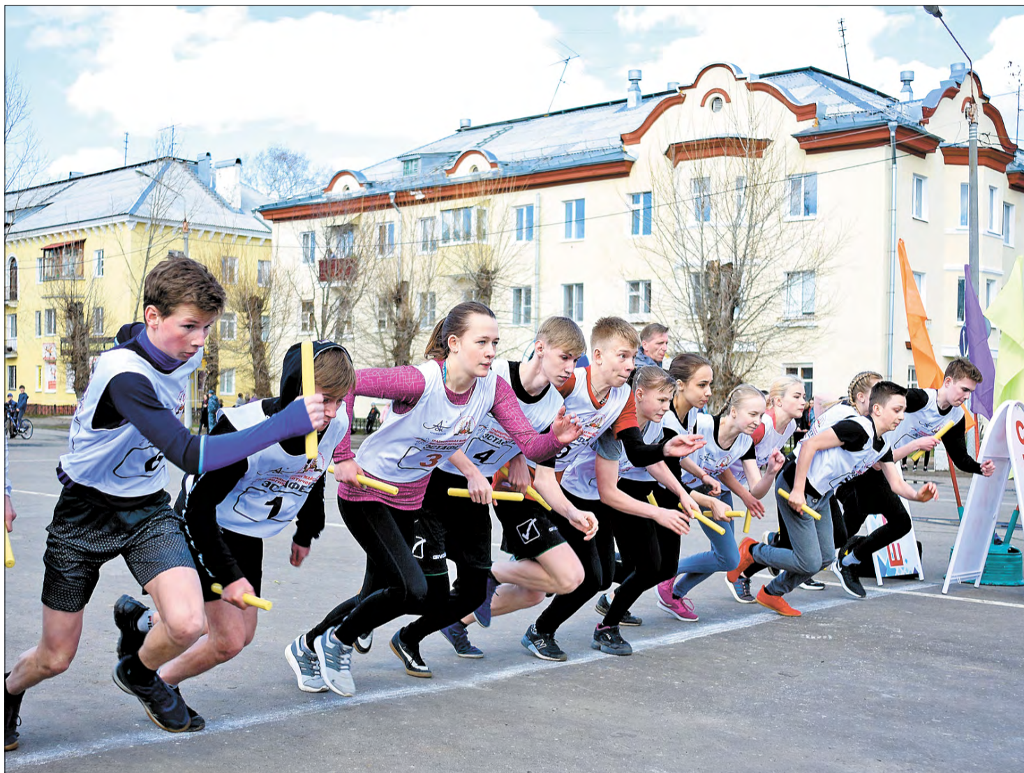
СТРЕМИТЕЛЬНЫЙ старт майской эстафеты на призы комбината