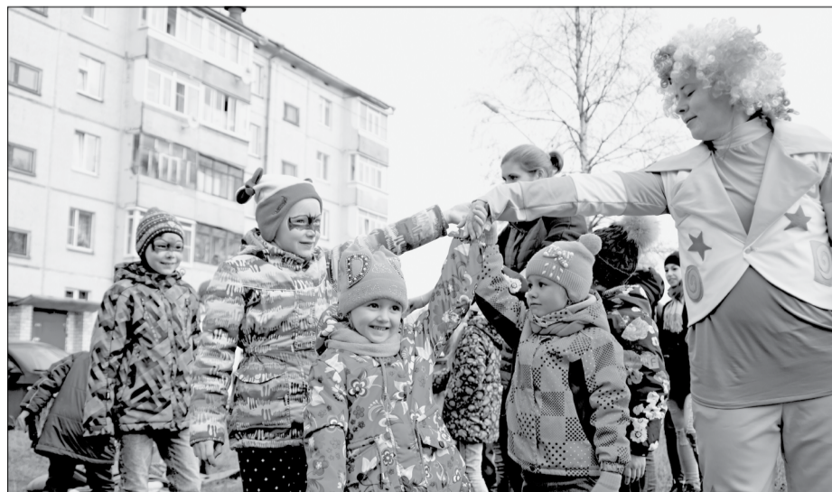
Благоустройство двора возле домов №27 и №29 на улице Мельникова и развлекательная программа для детей. Эта акция состоялась в 2018 году благодаря участию активистов в конкурсе АЦБК «4Д: социальное измерение – Давайте Делать Добрые Дела»

С одного IP-адреса, электронной почты, стационарного и мобильного телефона учитывается только один голос. Разрешается отметить до пяти проектов. Общественное голосование завершится 26 мая.