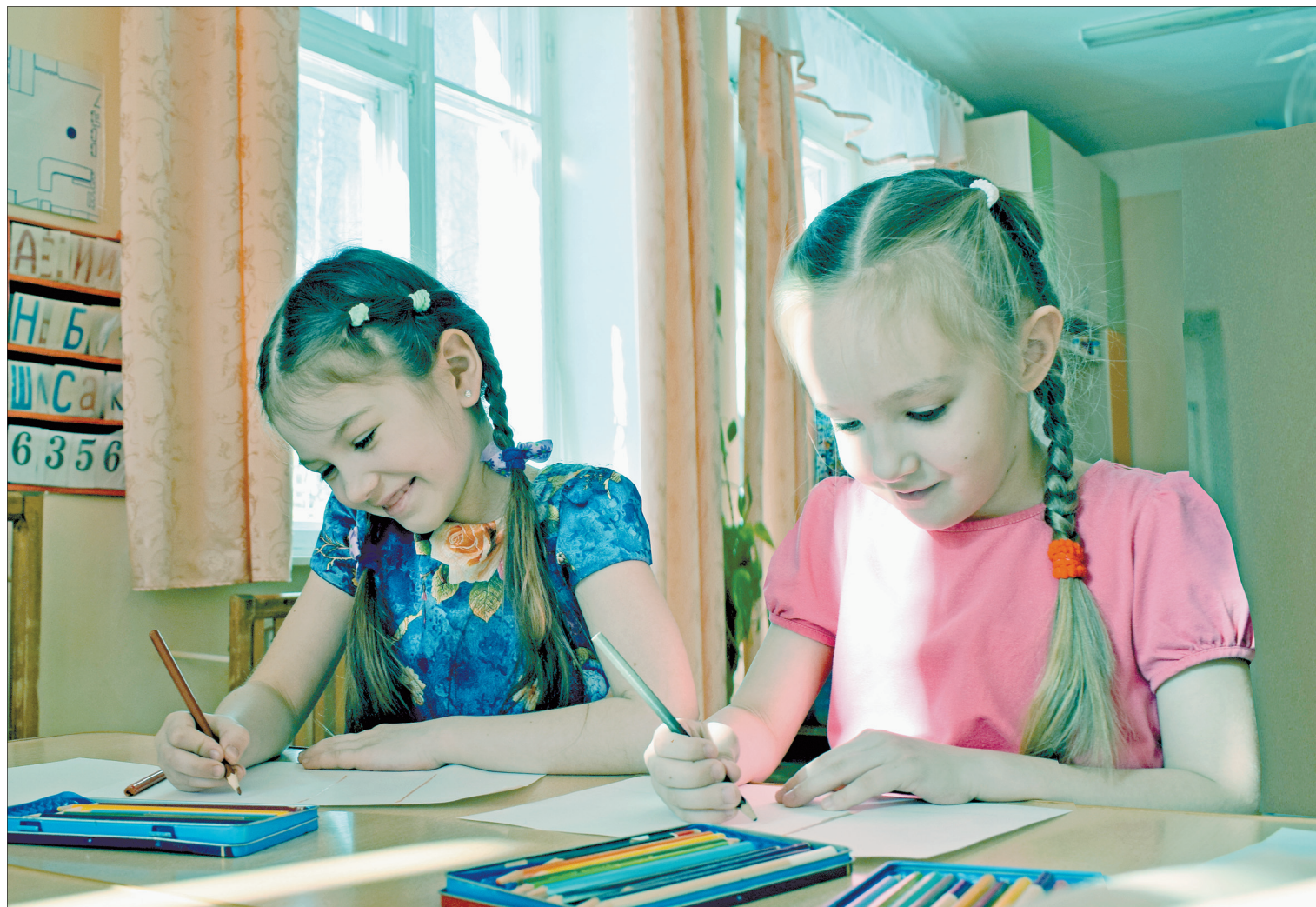
ВОСПИТАНИЦЫ детсада №19 рисуют на бумаге, подаренной Архангельским ЦБК