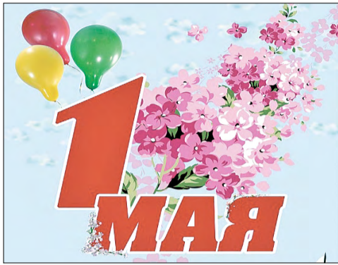
Программа празднования Дня Весны и Труда

В предстоящем месяце отмечается два государственных праздника: День Весны и Труда и День Победы. Публикуем анонсы событий, посвящённых этим памятным датам, а также рассказываем о спектаклях, концертах и мероприятиях, которые будут проходить в майские дни. Проводите весну интересно и легко вместе с нашей афишей!