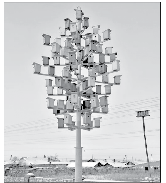
Уличный арт-объект «Скворечник»

Заявки на участие в конкурсе принимаются до 1 июля 2019 года в административной группе службы административного директора АЦБК. Их можно передать в электронном ( kogoleva.lyudmila@aprm.ru ) или печатном виде.