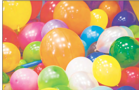
Также в праздничные дни: