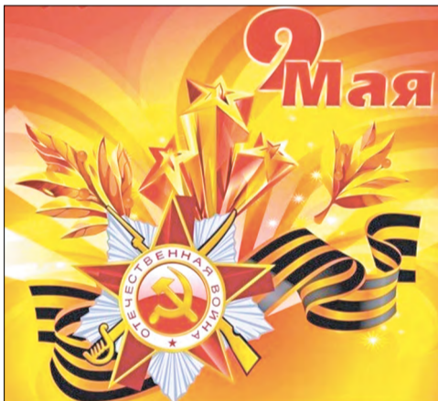
Программа празднования 74-й годовщины Победы в Великой Отечественной войне