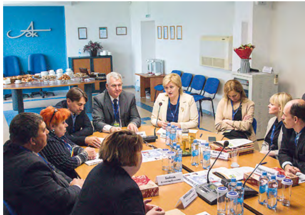
Выездное заседание РАО «Бумпром» на Архангельском ЦБК