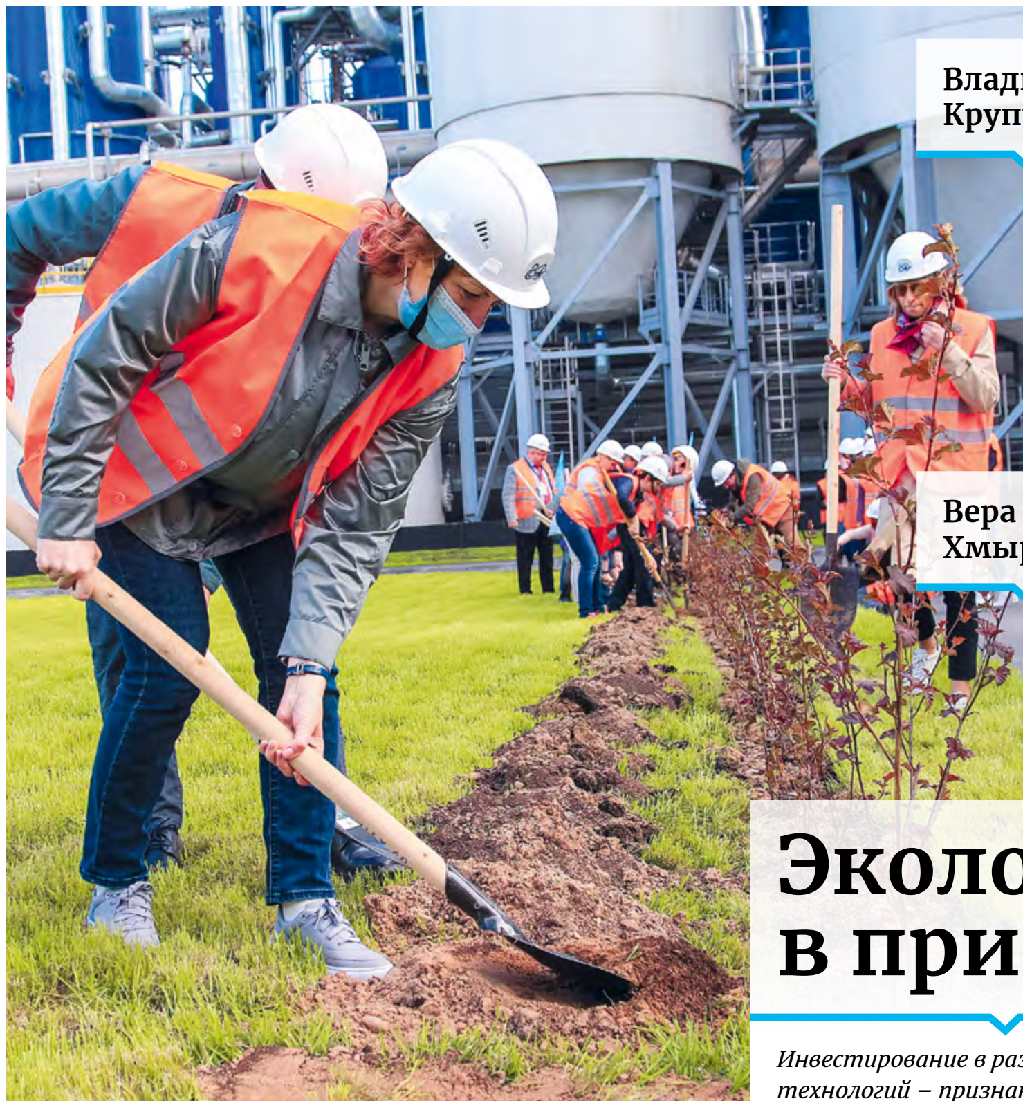
На фото: посадка деревьев у новой выпарной станции Архангельского ЦБК