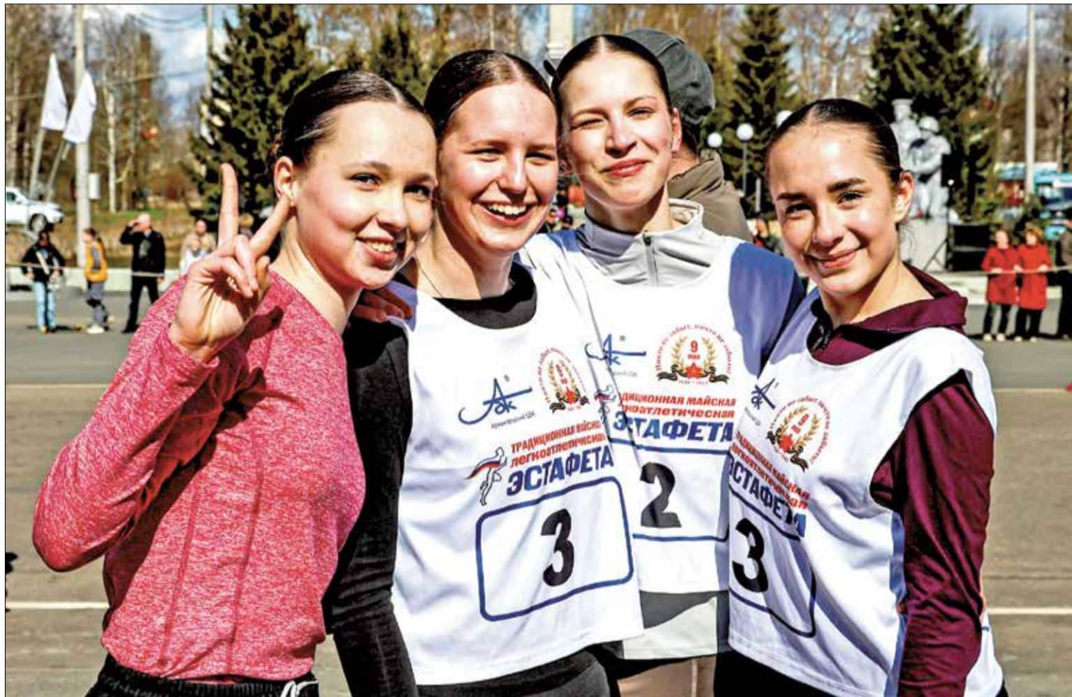
ВОСХИТИТЕЛЬНЫЕ и спортивные участницы забегов на призы Архангельского ЦБК