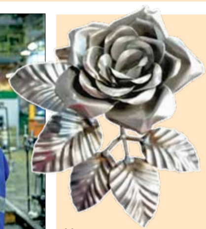
Металлическая роза, сделанная руками Майи Емелиной