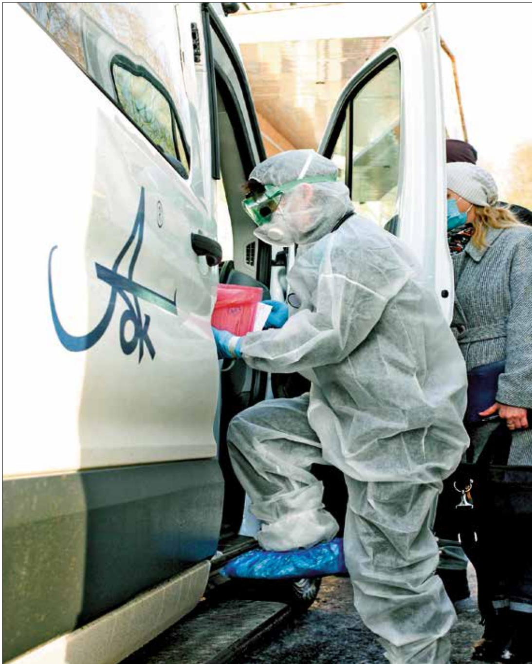
КОМБИНАТ предоставил транспорт для новодвинских медиков, выезжающих на вызовы больных COVID-19