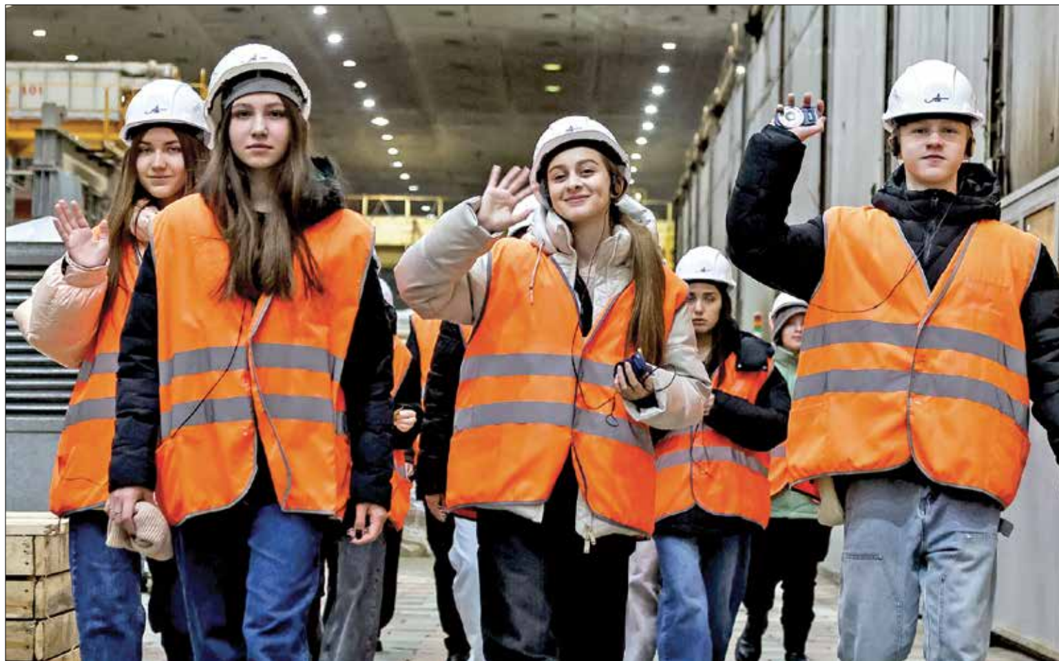
КАЧЕСТВЕННО образованные сотрудники и внедрение инноваций – основа успехов Архангельского ЦБК