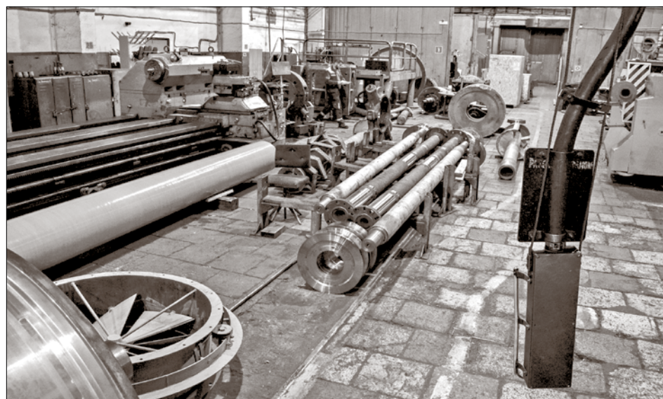
На ремонтно-механическом производстве АЦБК