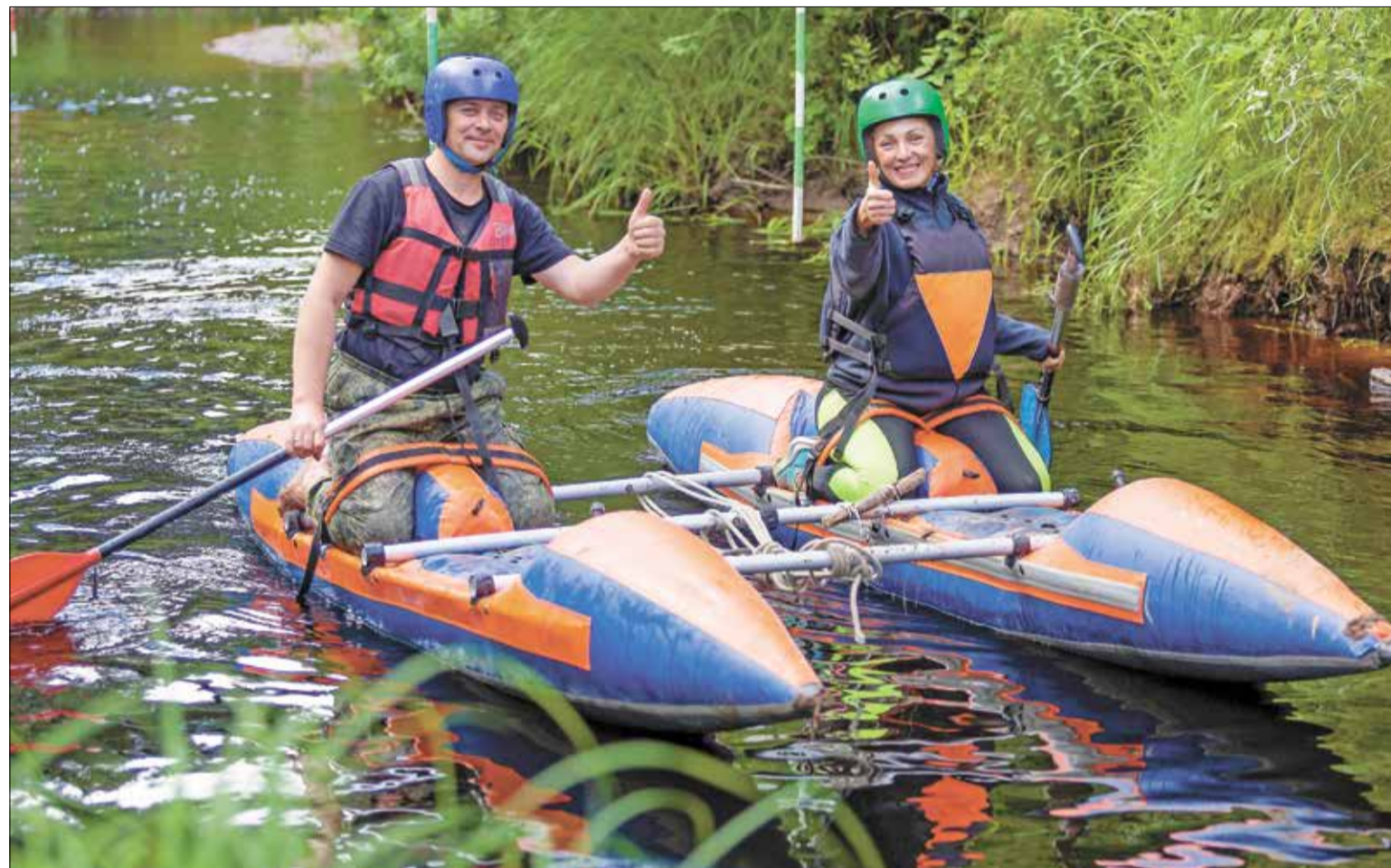
НА корпоративном турслёте Архангельского ЦБК. Было увлекательно и азартно!