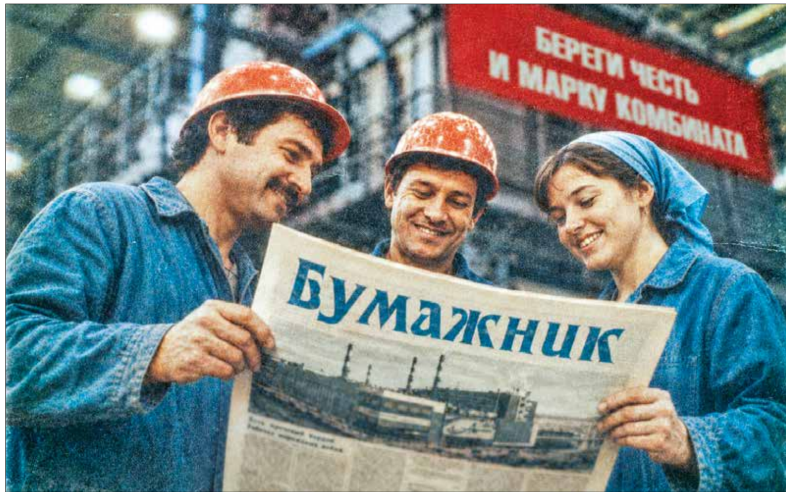
СЛОВО И ДЕЛО нашего заслуженного Архангельского ЦБК