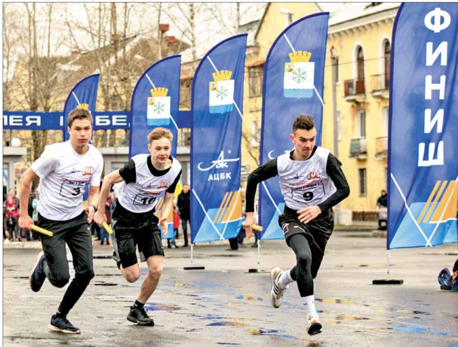
УСПЕШНЫЕ старты и финиши на эстафете АЦБК – 2021