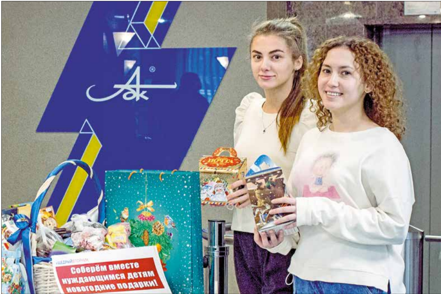
РАБОТНИКИ АЦБК собрали много подарков для детей в рамках благотворительной акции «Щедрый вторник»