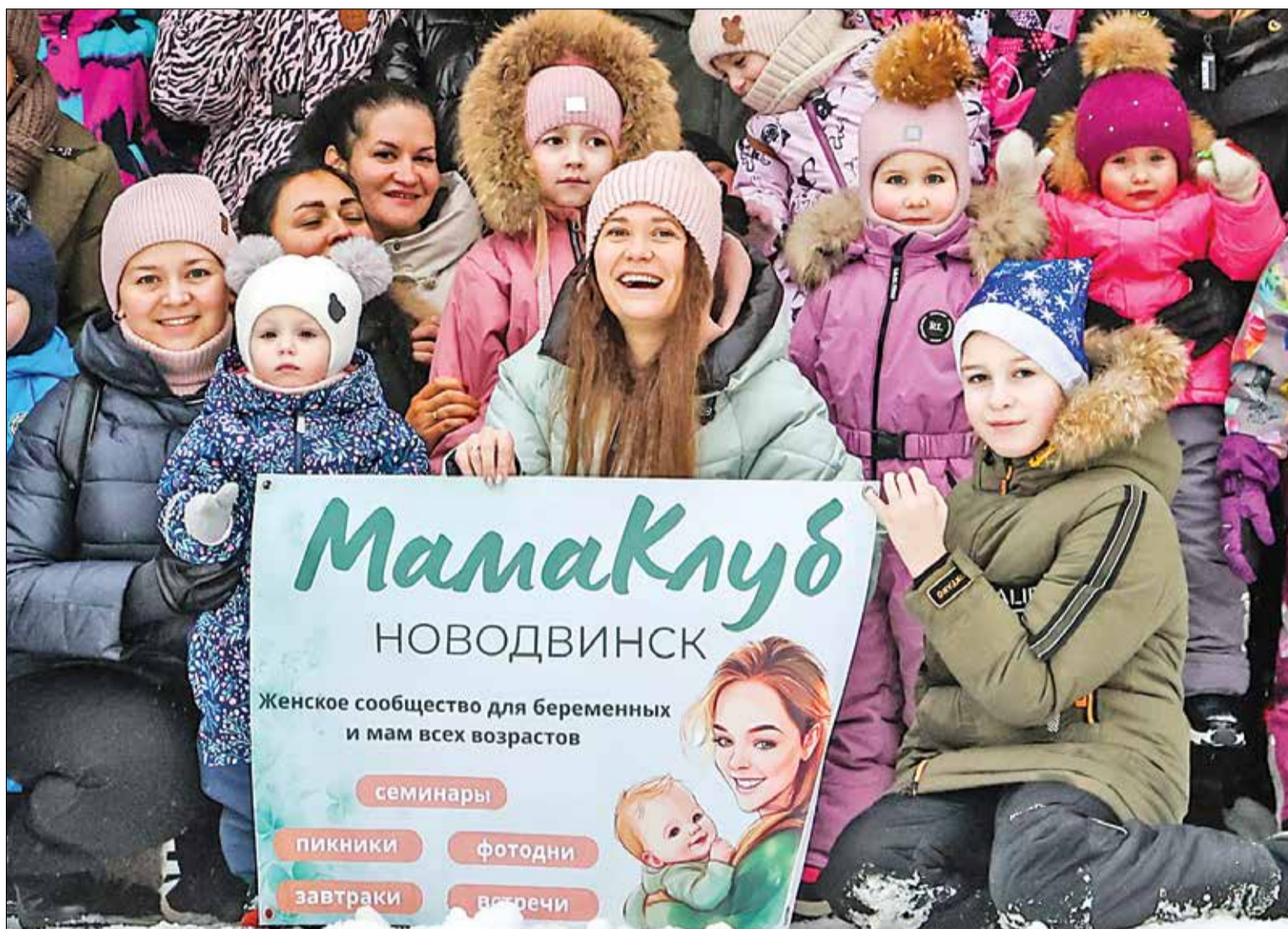
УЧАСТНИЦЫ объединения «МамаКлуб Новодвинск», получившего грант конкурса «4Д»