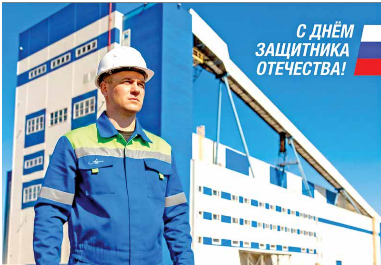
НА АРХАНГЕЛЬСКОМ ЦБК трудятся ответственные и сильные мужчины