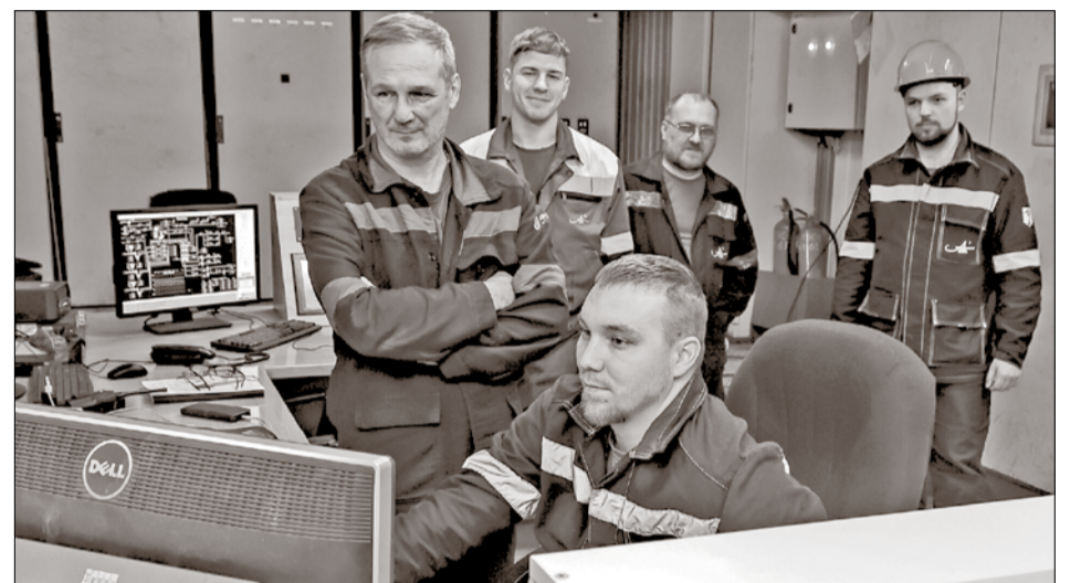
На первой теплоэлектростанции Архангельского ЦБК

В сооружении 11-го котла были задействованы специалисты компании «СоЭнерго+» (Москва), занимающейся работами по комплексному промышленному монтажу технологического оборудования, трубопроводов, машин, металлоконструкций, инженерных систем, электроснабжения и автоматизации.