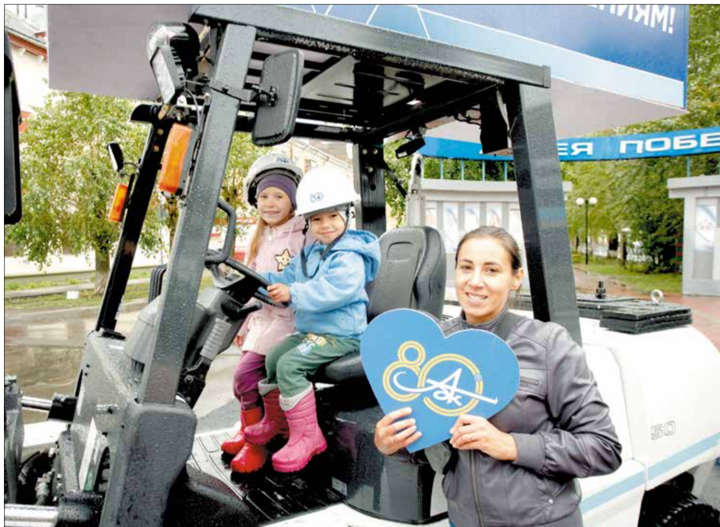
ФОТОЗОНА Архангельского ЦБК. Снимок на память о 80-летию комбината и Дне города