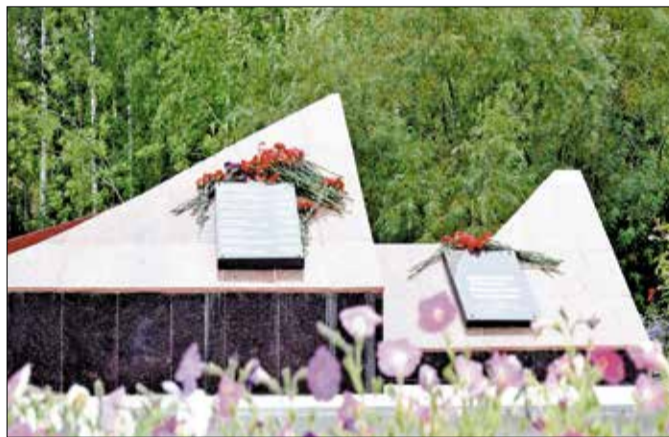
Обновлённый мемориал погибшим в локальных конфликтах

рый выиграло новодвинское отделение Российского союза ветеранов Афганистана.