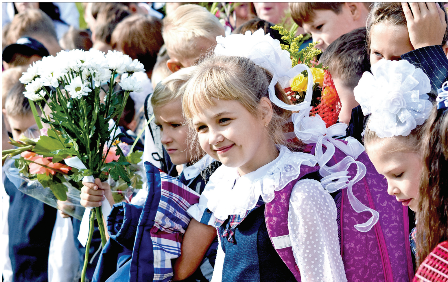
В ПЕРВЫЙ погожий сентябрьский денёк...