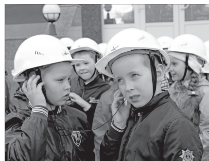
Эколята 25-й гимназии Архангельска на АЦБК

АО «Архангельский ЦБК» – инициатор и организатор конкурса «Лучший слоган» среди региональных организаций – участников природоохранных социально-образовательных проектов «Эколята».