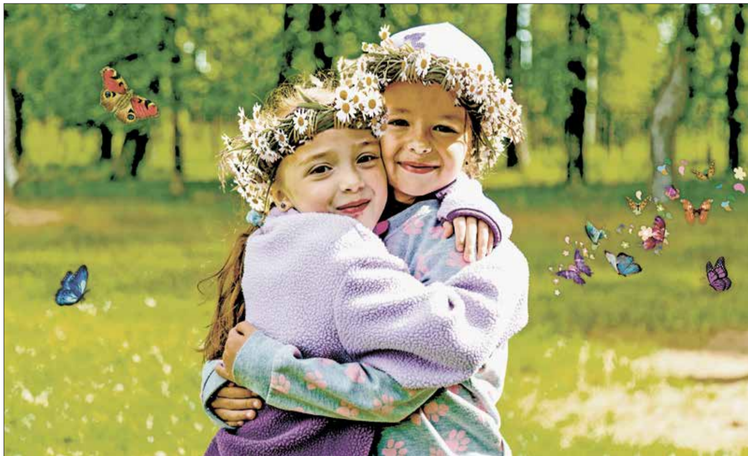
ДЕТИ сотрудников комбината отдыхают в здравницах. Лето – это маленькая жизнь!