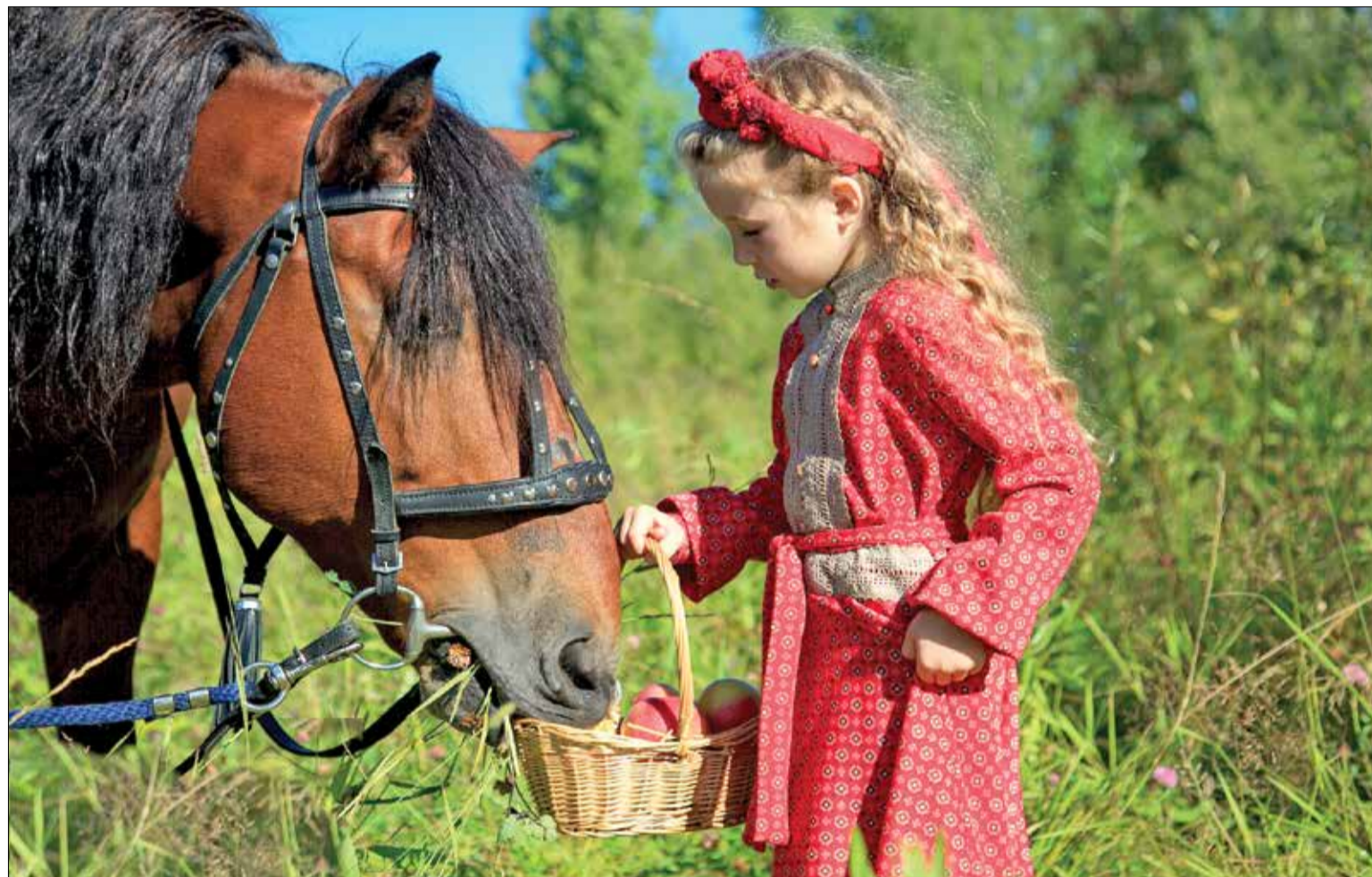
ЭТЮД из жизни конноспортивного клуба «Чародей», который вновь стал одним из победителей конкурса «4Д»