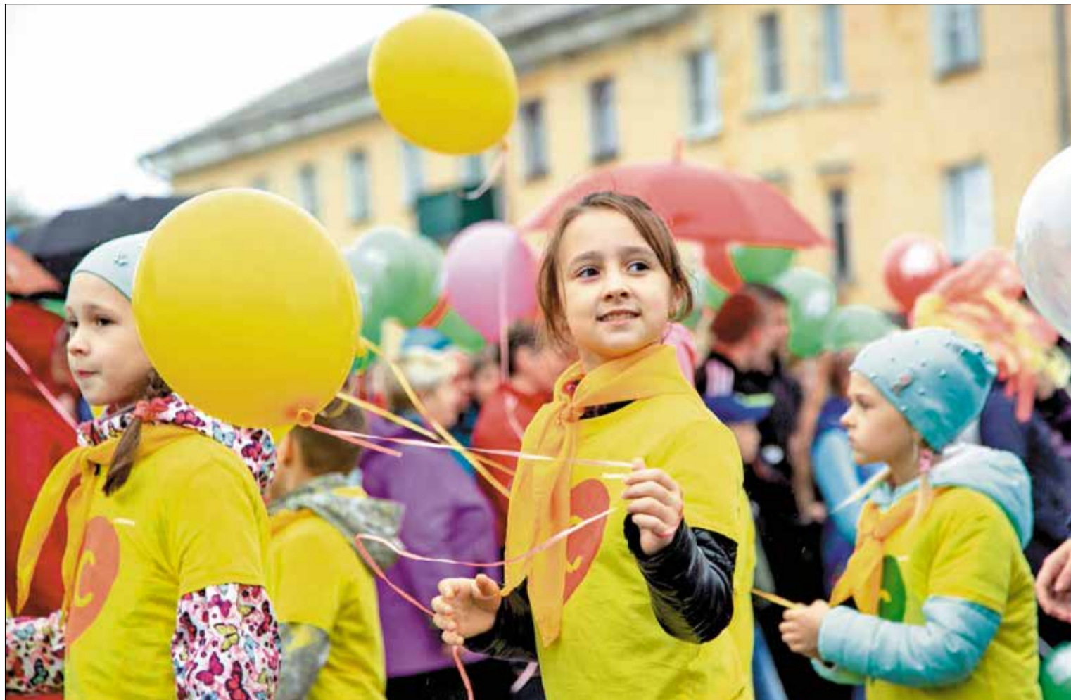
СОЦИАЛЬНАЯ программа Архангельского ЦБК «4Д» делает жизнь новодвинцев комфортнее, лучше и ярче