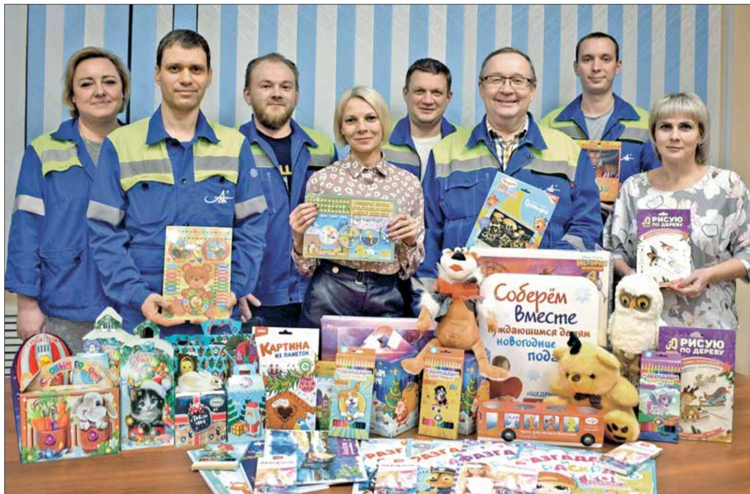
РАБОТНИКИ комбината от всего сердца помогли детям