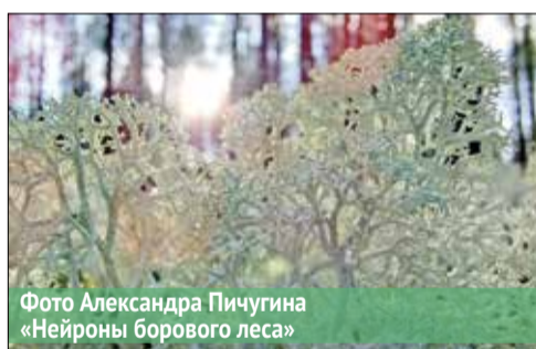
Фото Александра Пичугина «Нейроны борового леса»