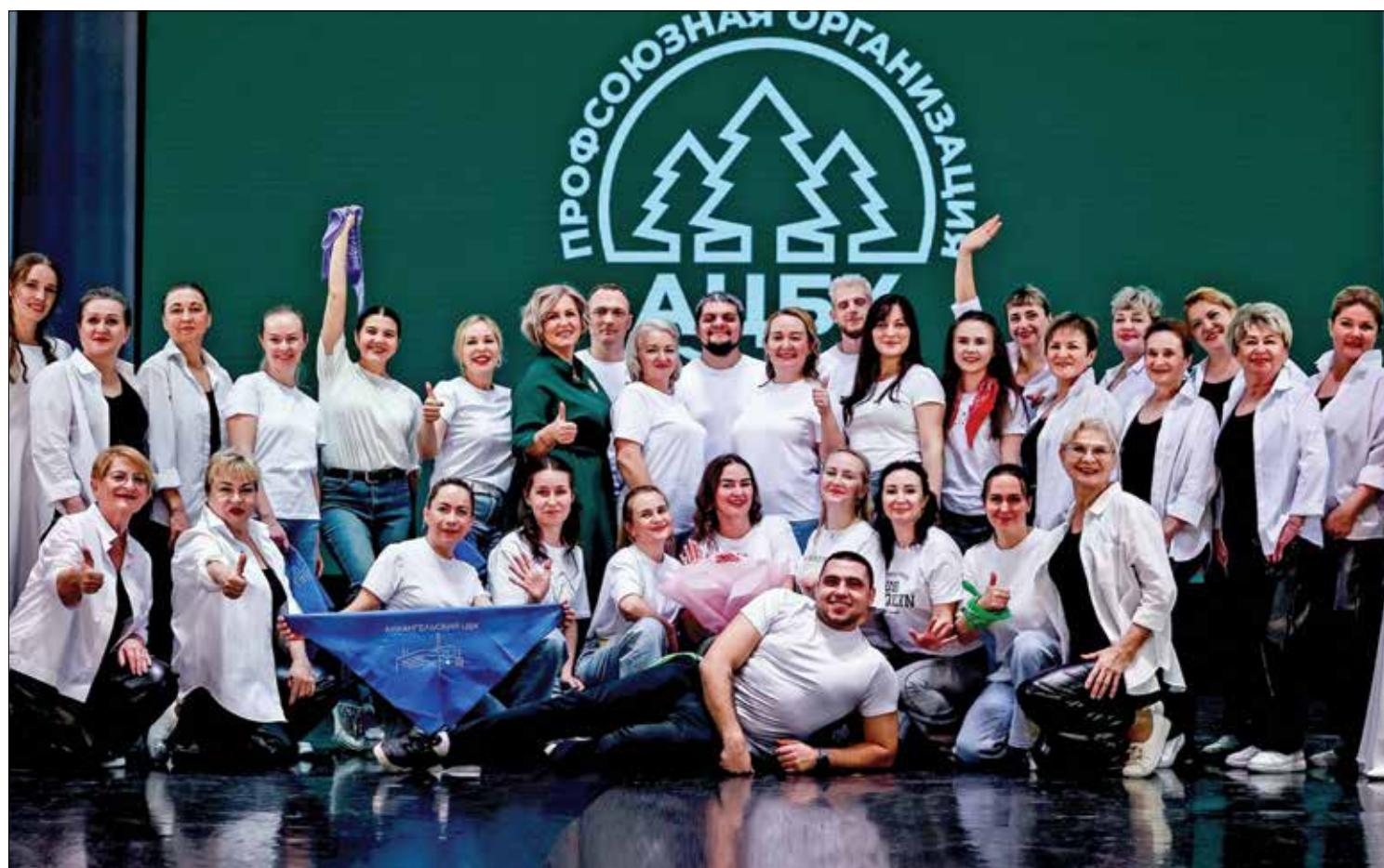
ПРОФСОЮЗ АРХАНГЕЛЬСКОГО ЦБК отметил красивый юбилей