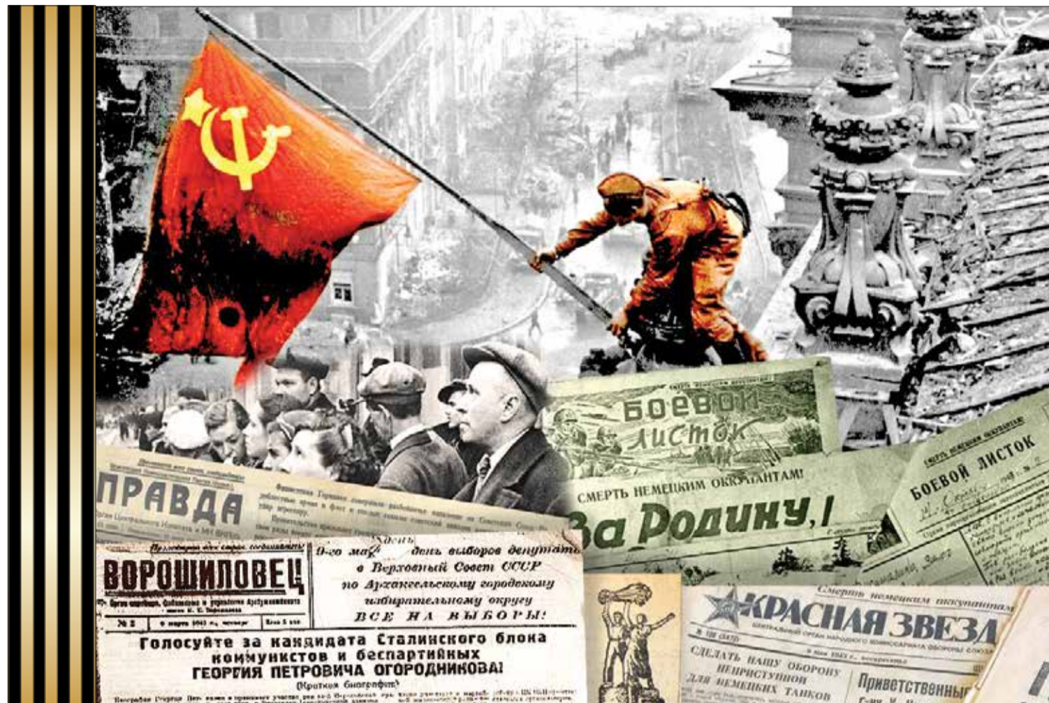
ГАЗЕТЫ в годы Великой Отечественной войны приближали Победу