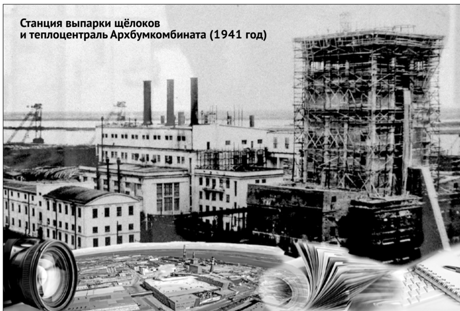
Станция выпарки щёлоков и теплоцентральный Архбумкомбината (1941 год)

Стояли наборщики каждый у своей кассы, складывали строчки. Буква за буквой – слово. Слово, ещё слово – строчка. Большой, утомительный труд. Тронь неосторожно строчку, и рассыплется целая колонка, придётся набирать заново. Только после внедрения линолипа верстальщик мог уверенно ставить сразу строк 30–40.