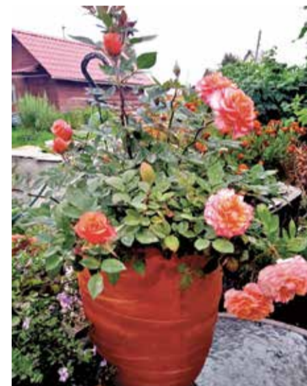
Цветы Ольги Гусевой