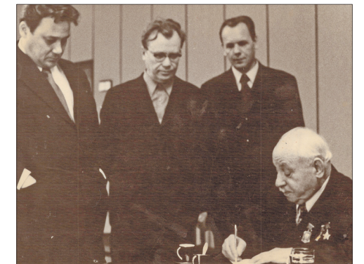
Дважды Герой Советского Союза контр-адмирал Иван Дмитриевич Папанин посетил Архангельский ЦБК в апреле 1975 года.

Подведены итоги всероссийского проекта «Великие имена России». Аэропорт Архангельск «уступил» имя Михаила Ломоносова аэропорту Домодедово. Теперь нас ждёт второй тур выборов.