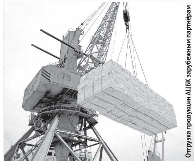
Отгрузка продукции АЦБК зарубежным партнёрам

Хорошие результаты продемонстрировала и Группа компаний «Титан», экспортировавшая своей продукции на 115,3 миллиона долларов, сегмент продаж за рубеж в её выручке составил 29,8%. ГК «Титан» сотрудничает с 13 странами-им-