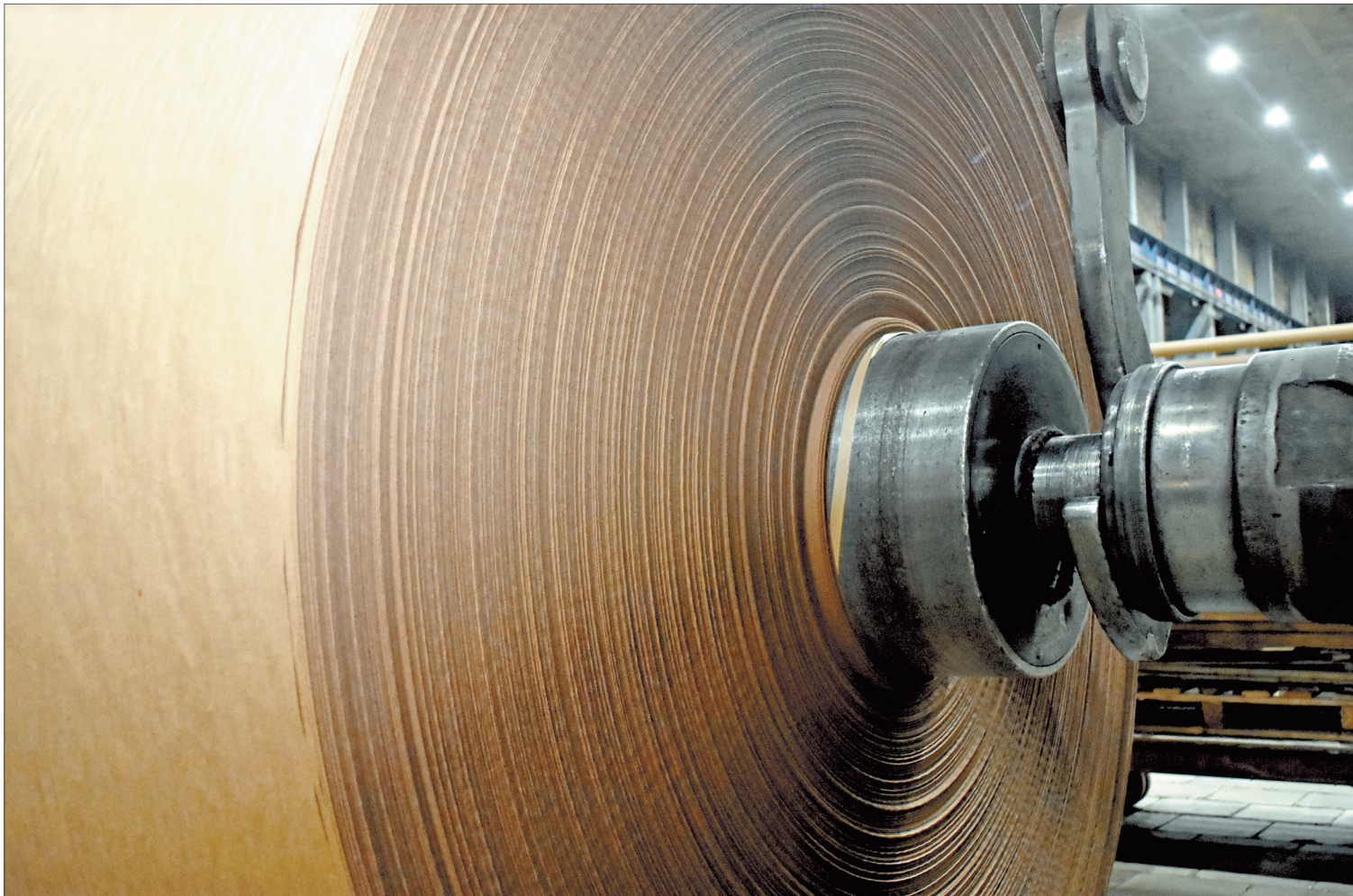
КАРТОН Архангельского ЦБК – качество на высшем уровне!