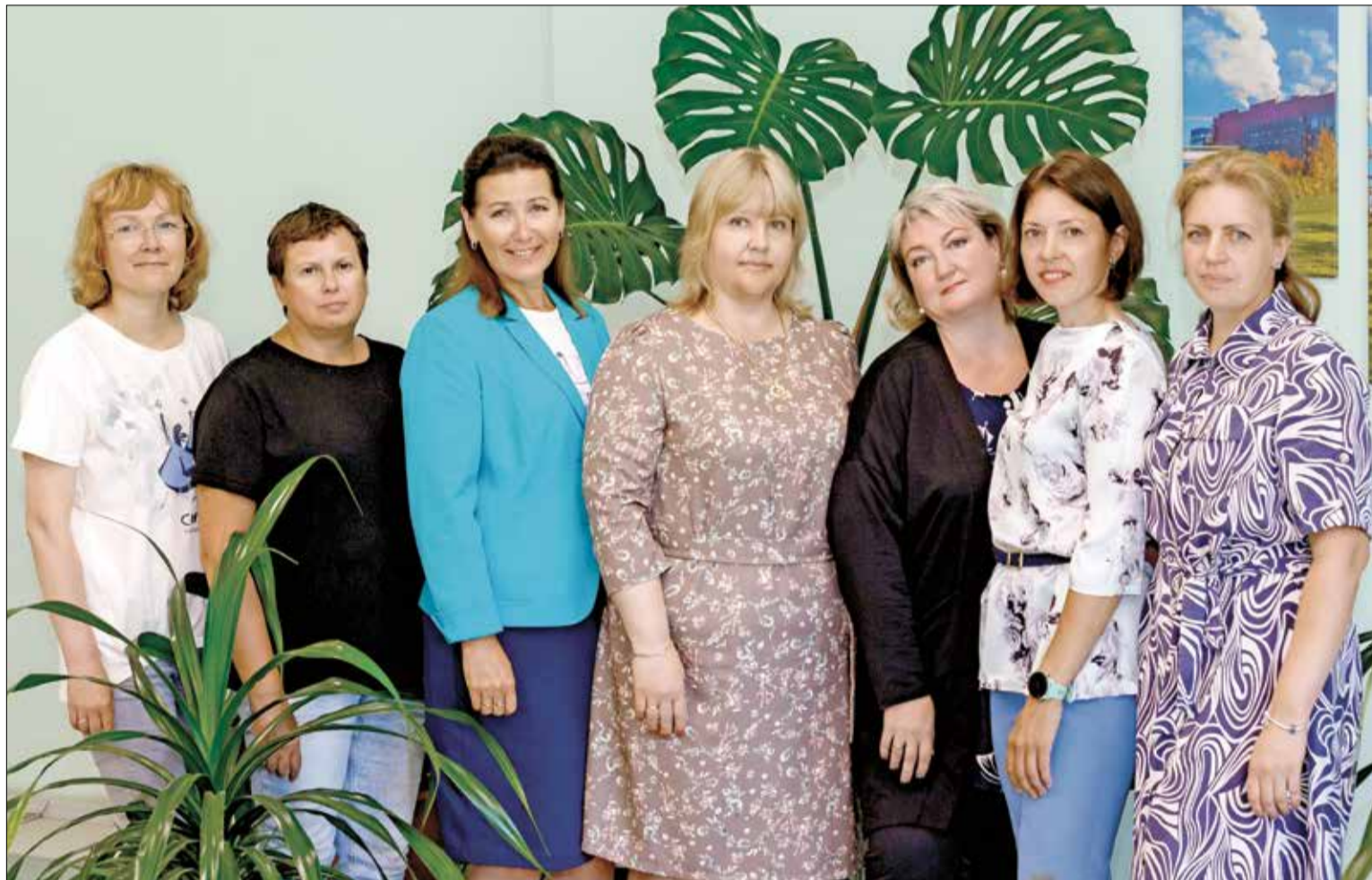
СОТРУДНИКИ центральной диспетчерской службы Архангельского ЦБК